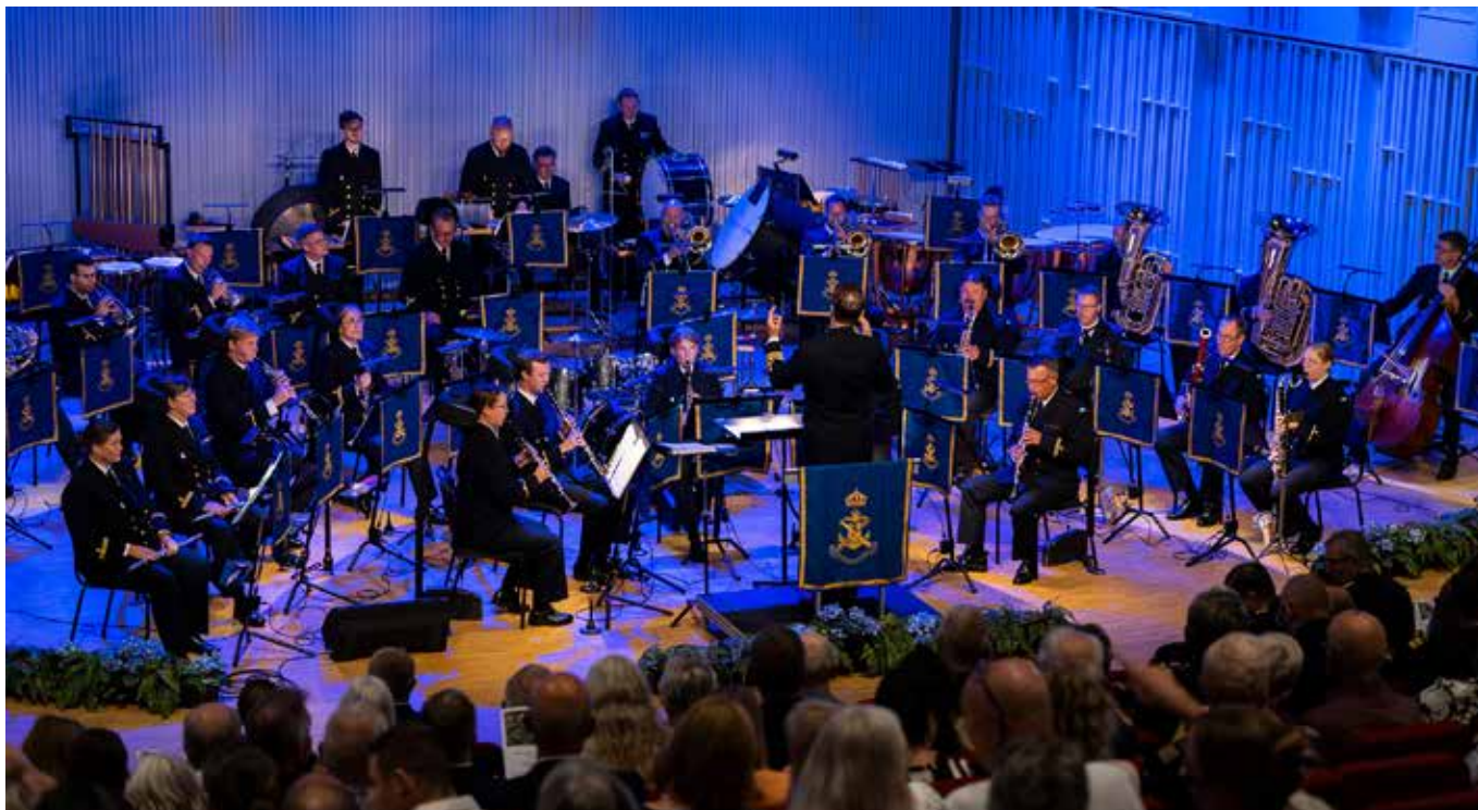
Marinens Musikkår spelade vid MHS H:s 25-årsjubileum.

utvecklingsbehov som kunskap om möjligheter inom området personal- och kompetensförsörjning, och få möjlighet att omsätta dessa till verklig