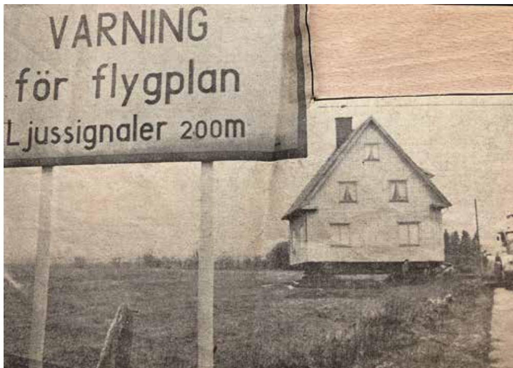
Huset drogs på trärullar över åkern innan det nådde Karlsrovägen.