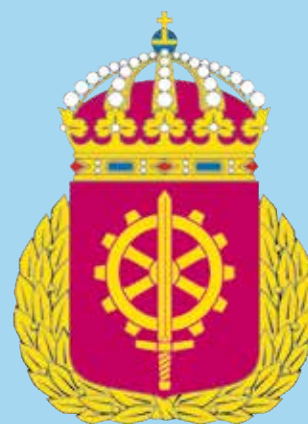
Försvarmaktens tekniska skola