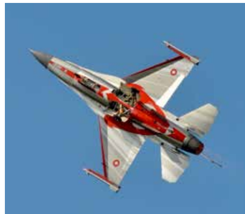
Både danska flygplan (bilden ovan) och norska (nedan) gick att se på flygdagen i Kallinge, dessutom uppvisning av bland annat Draken och Gripen. Bilden till vänster visar att flygdagen var välbesökt.