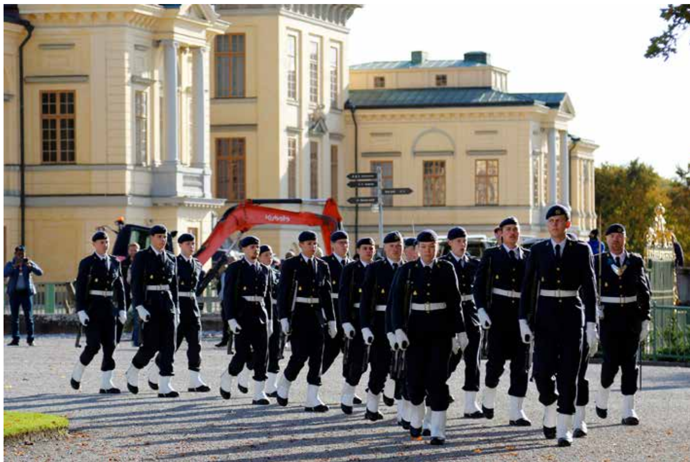
Kungen kunde sova tryggt om natten när soldater från FMTS gick högvakt vid Drottningholms slott.