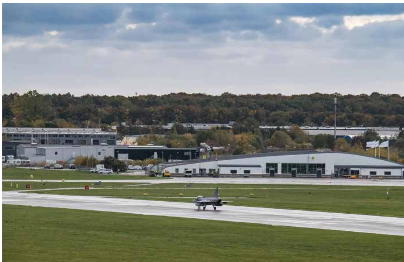
Jas 39 Gripen landar i Halmstad för Flygvapnets första övning i stan på 47 år.