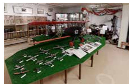
Ovan: Inne i museet.