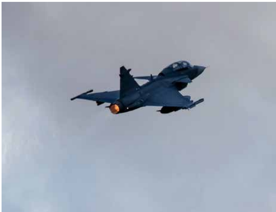
Syftet med övningen var att öka luftstridskrafternas förmåga till nationellt försvar av Sverige.

Lars-Åke Johansson pratar om övningen som en stor tårta, delad i