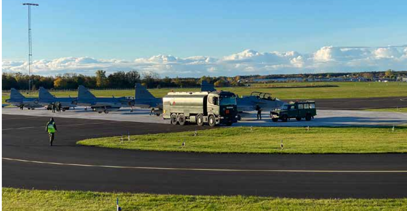
Fem Jas 39 Gripen på plattan i Halmstad, en ovanlig syn. Logistikenheten svarar för tankbil och tankning.