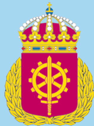
Försvarsmaktens tekniska skola