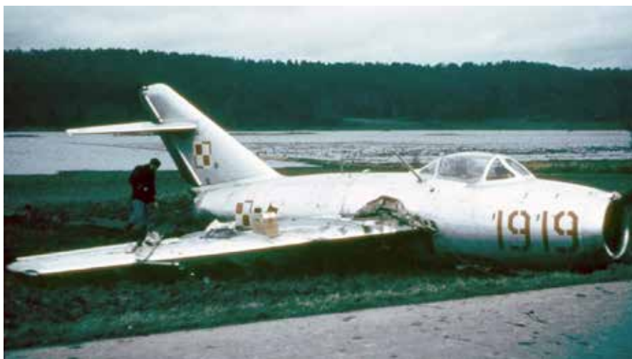
MIG-15 släpad till Boråsvägen för demontering av vingar.