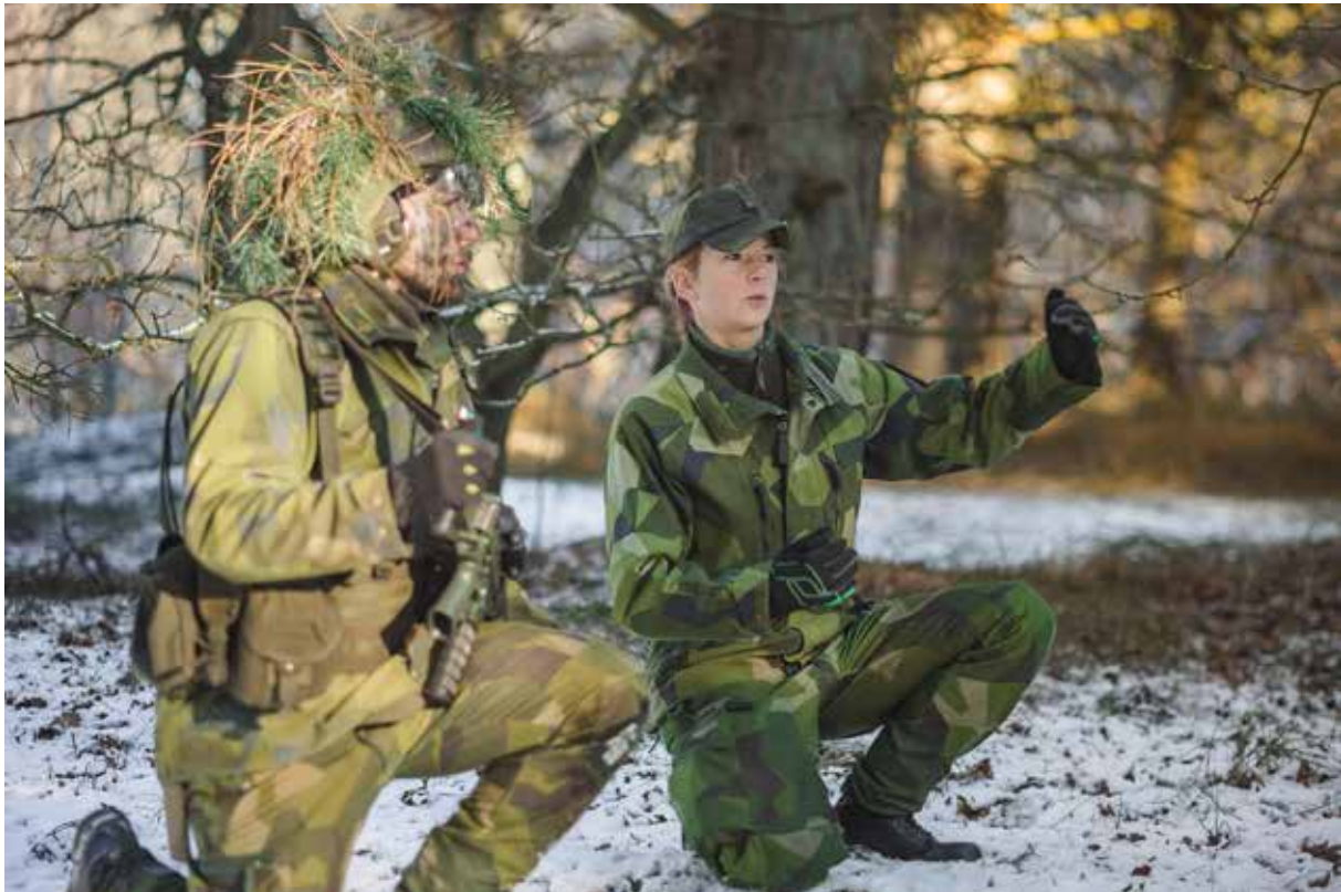
Pedagogisk situation i fält.