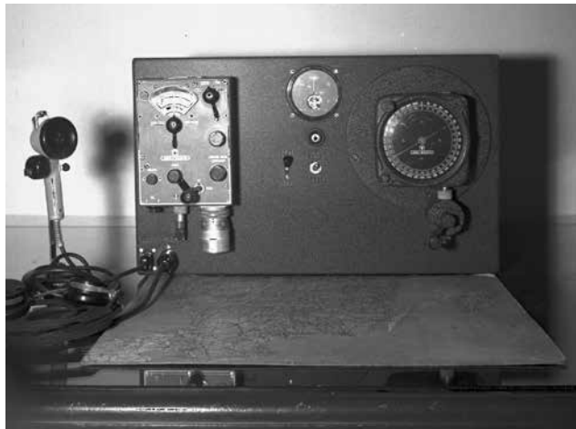
Telegrafistens plats med pejlmottagare Frp II och utrustning för kommunikation med föraren.

Pejlanläggningen är anordnad på följande sätt. På ett tak ovanför kartan är placerat ett trettiotal enrörs sändare (radiofyrar), med var sin antenn. Fyrarna består av s k Colpitts-kopplade (Colpitt efter uppfinnarens namn) oscillatorer, med fasta kondensatorer och trimbara induktanser. På kartan är utprickat de radiofyrar, som i verk-