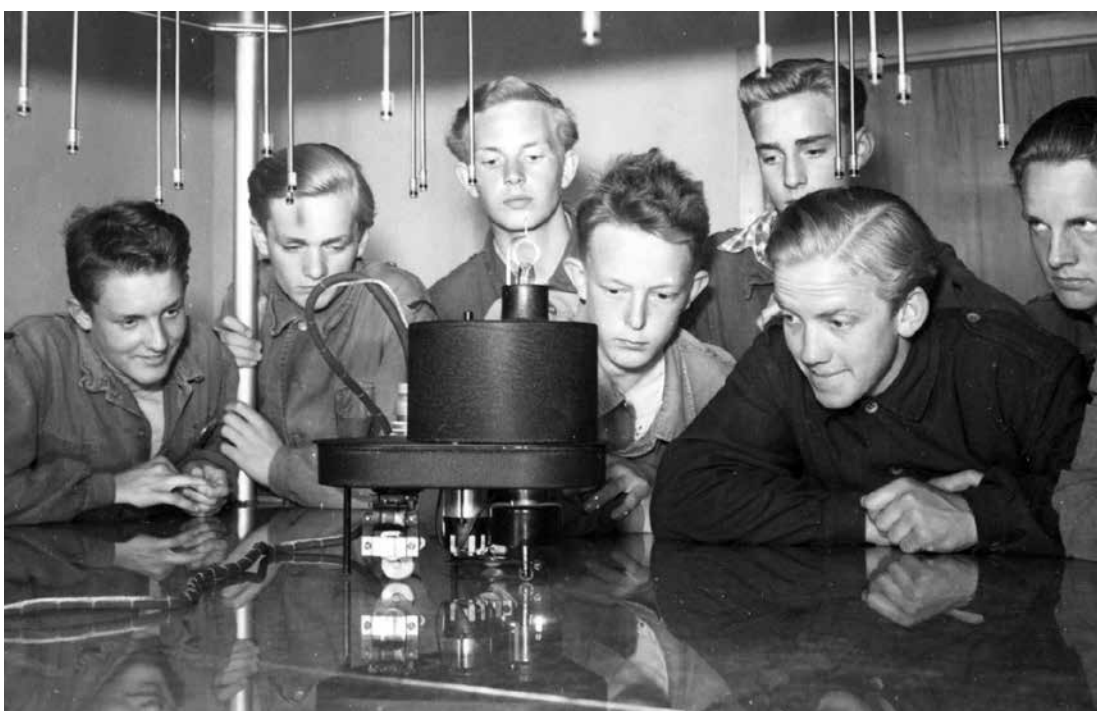
En grupp flygpojkar följer intresserat Krabbans färd över kartbordet. Obs radiofyrantennerna över bordet och pejlantennen ovanpå Krabban.

Övningsledare, förare och signalist står i förbindelse med varandra via en telefonanläggning. Genom en särskild anordning kan övningsledaren koppla bort föraren eller signalisten, vilket ur undervisnings-synpunkt är nödvändigt.