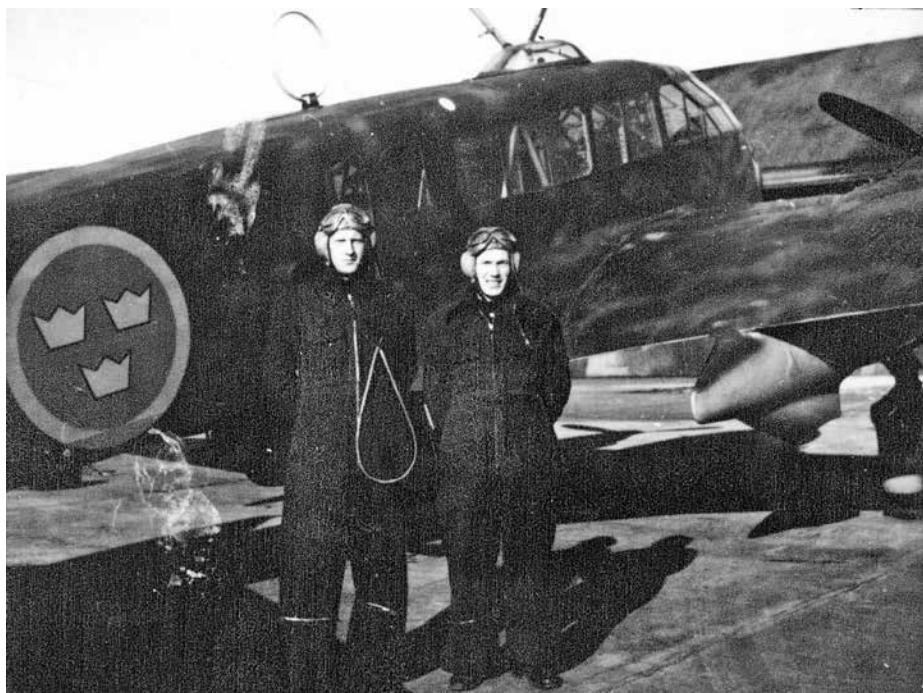
Halv besättning på S 16 Caproni. Flygskytten till höger omkom tillsammans med övriga i flygplanet vid ett haveri söder om Blekinge under återflygning från spaningsuppdrag mot tyska kusten den 5 juni 1944.