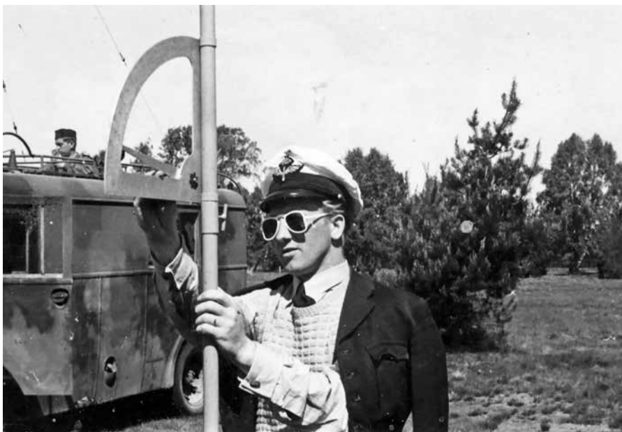
Dykvinkelmätning vid Skedala hed utanför Halmstad. Dykmålet var utlagda dukar och "kärrans" dykvinkel (som regel önskad 45 grader) meddelades till flygföraren per UK (VHF). Men också oren dykning, till exempel "hänger på höger ving", meddelades.

B 18 med sin stora glasnos konstruerades för tre mans besättning – framsynt? "Den tredje mannen", bombfällaren, togs snabbt bort. Planbombfällning med B 18 i det nya luftkrigsscenariet med ökad risk för kraftig luftvärnsmotverkan skulle kunna bli mycket "hälsovådlig"! Krigserfarenheterna visade att metoden vid anfall var snabbt in – fäll/skjut – snabbt ut.