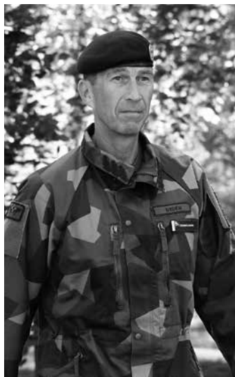
ÖB Micael Bydén överlämnade FMTS fana vid en ceremoni på Flottiljområdet en varm dag i maj.