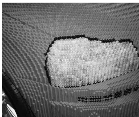
På museet finns en bil som är byggd av Legobitar.