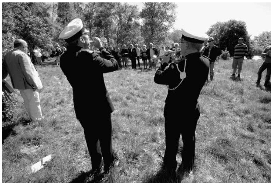
Uniformerade musiker spelade psalmer och tupto när minnesplattan för de fyra döda flygarna invigdes på torsdagen på Kullaberg.