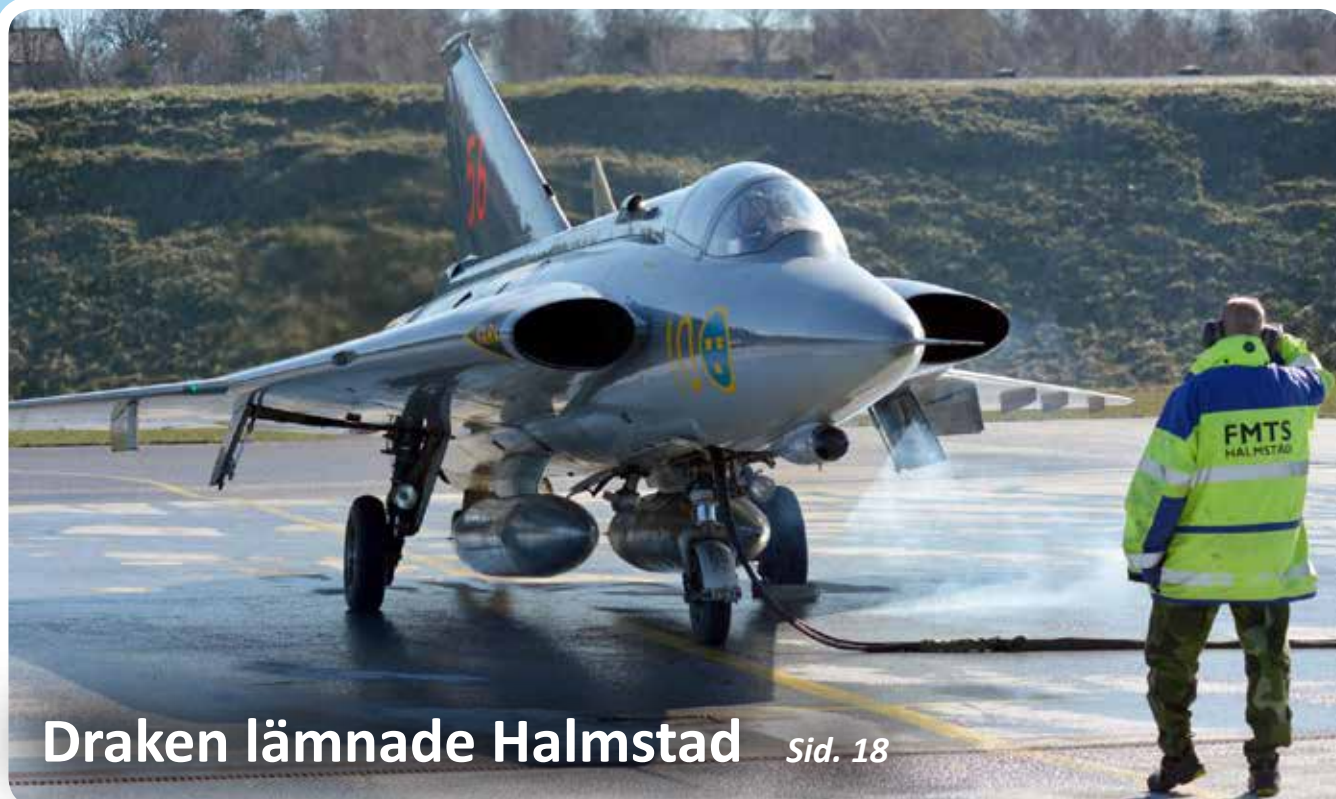
Draken lämnade Halmstad Sid. 18

En informationstidning för Flotttiljornådets Kamrat och Veteranförening