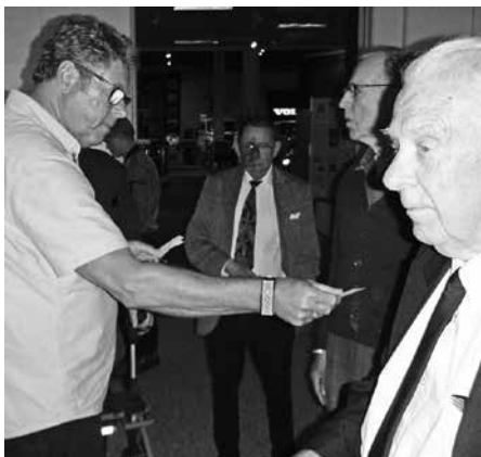
Reseledaren delar ut matkuponger.