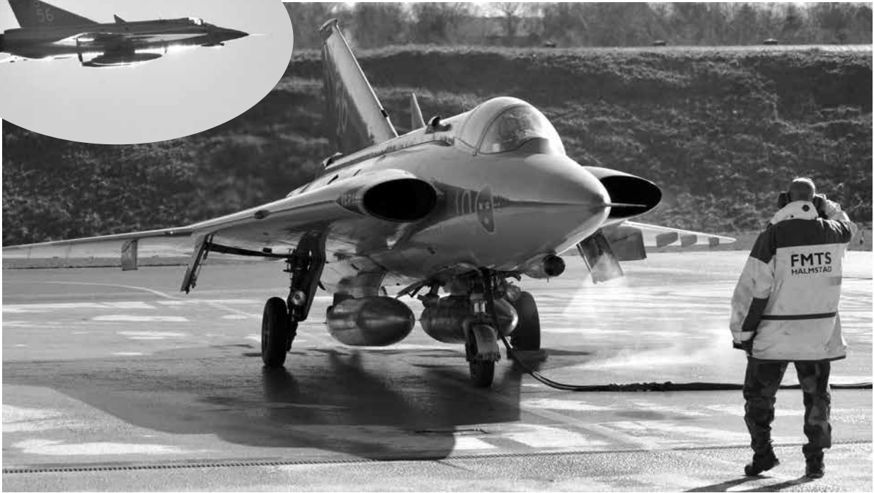
Per Bengtsson har gjort den sista klargöringen av sitt skötebarn.