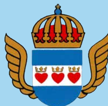
Flottiljområdets Kamrat och Veteranförening