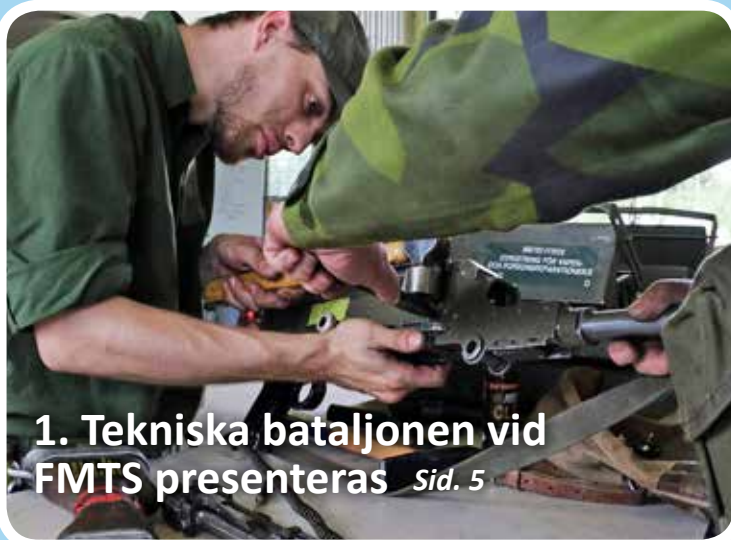
1. Tekniska bataljonen vid FMST presenteras Sid. 5