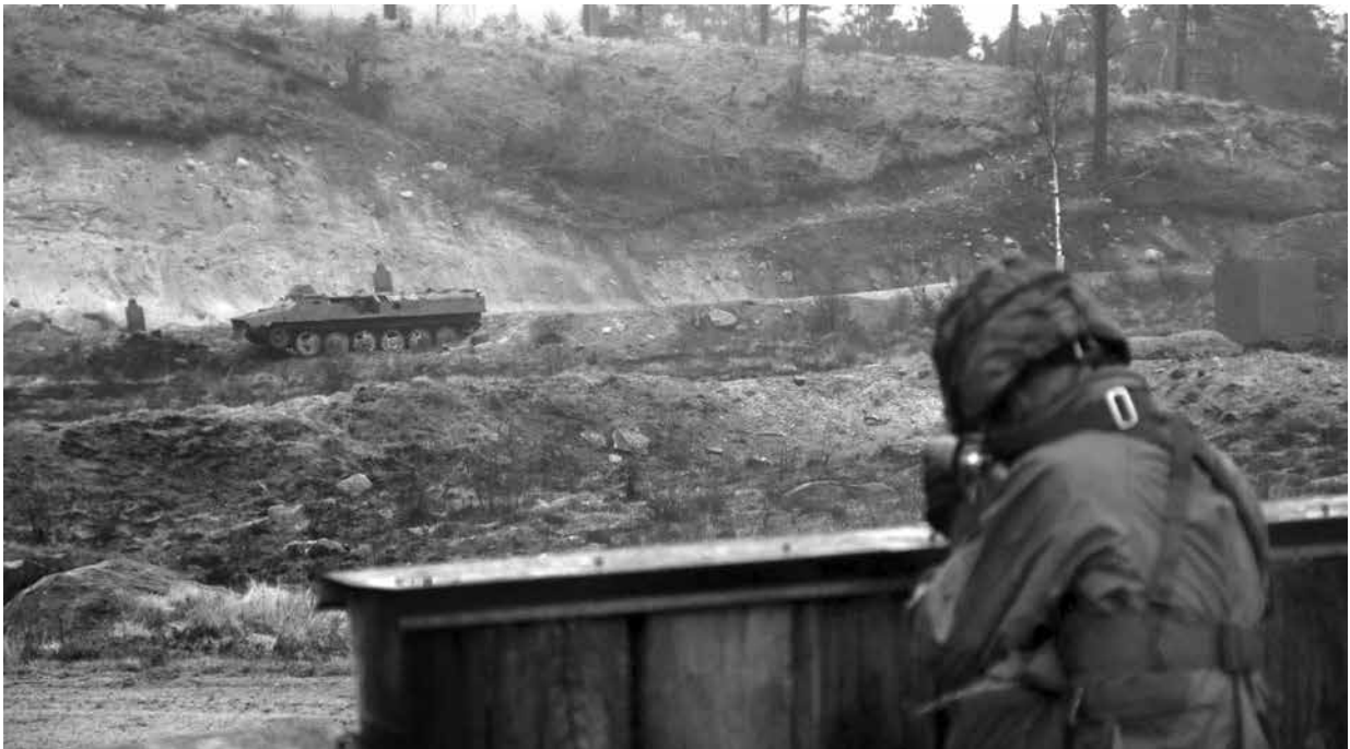
Ständigt nya uppdykande mål gör att det går en del ammunition under övningsmomentets genomförande.