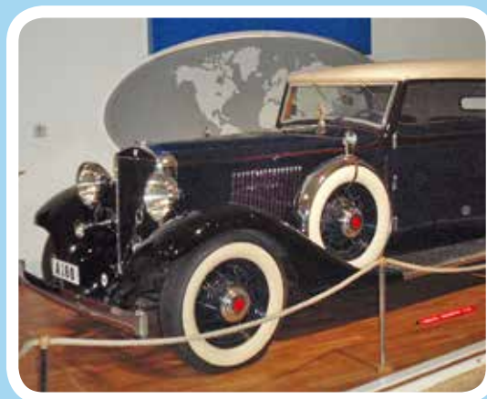
Kamrater på utflykt till Volvomuseet Sid. 14-15