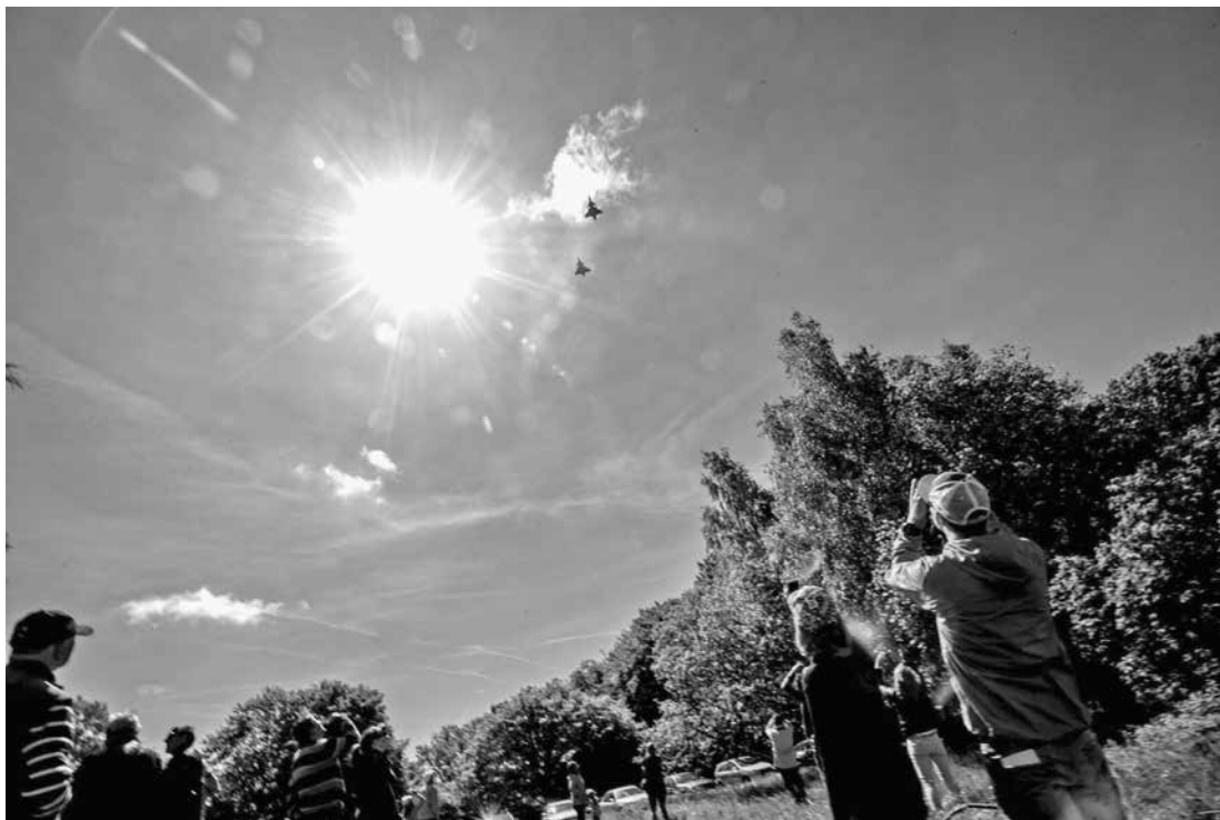
Två Jas 39 Gripen hedrade minnesceremonin med en överflygning klockan 11.20.