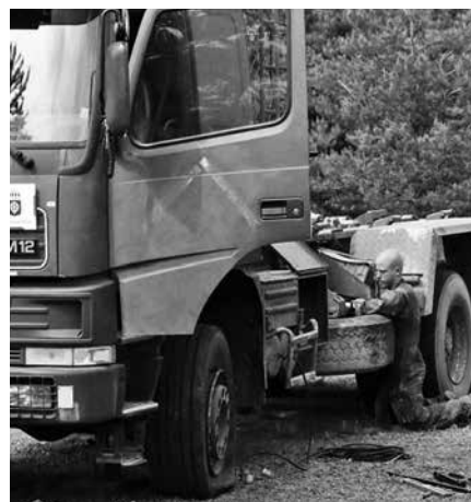
Punktering på en lastbil lagas vid övning Våreld.

Vi har sedan 2010 haft väldigt få avgångar och av de som valt att lämna har de flesta gått till ett annat förband av sociala skäl. För oss är detta ett kvitto på att soldaterna trivs bra vid bataljonen tack vare att vi behandlar dem som kollegor.