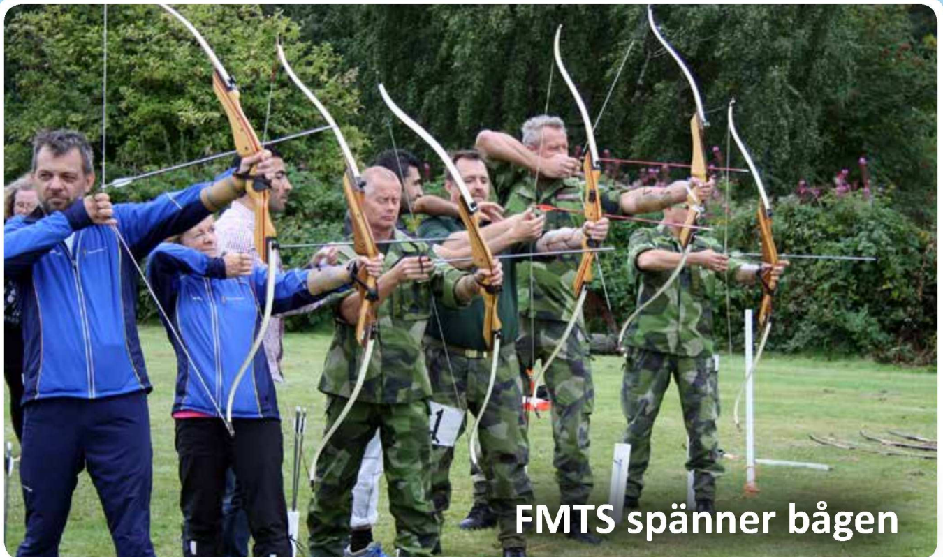
FMTS spänner bågen

En informationstidning för Flotttiljornådets Kamrat och Veteranförening