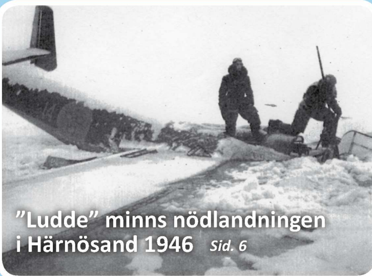
"Ludde" minns nödlandningen i Härnösand 1946 Sid. 6