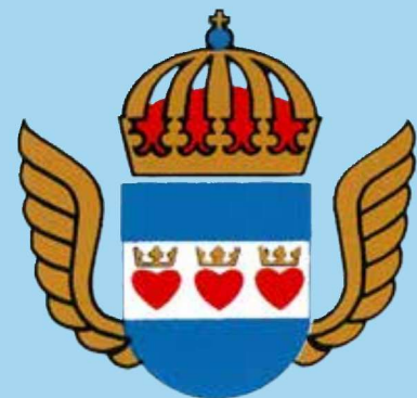
Flottiljområdets Kamrat och Veteranförening