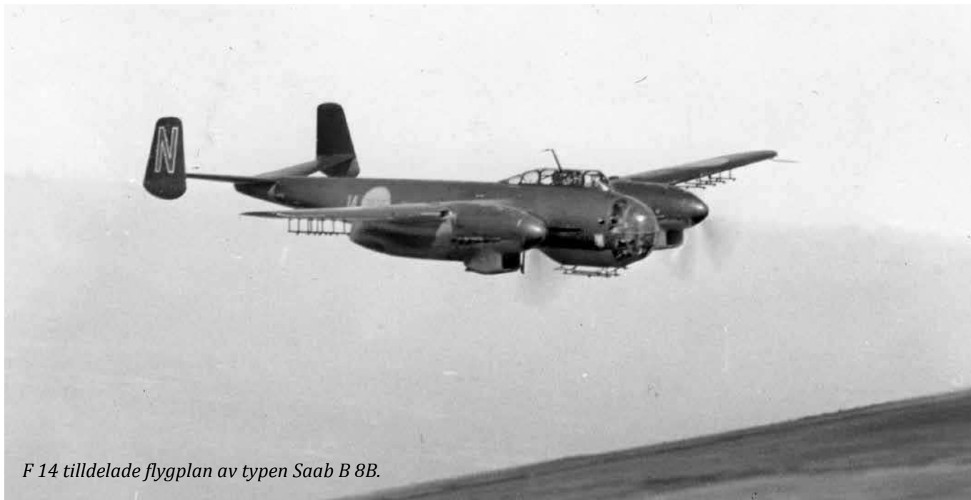
F 14 tilldelade flygplan av typen Saab B 8B.