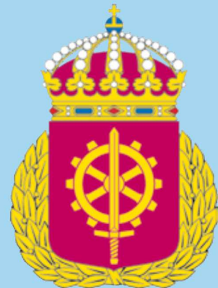
Försvarsmaktens tekniska skola