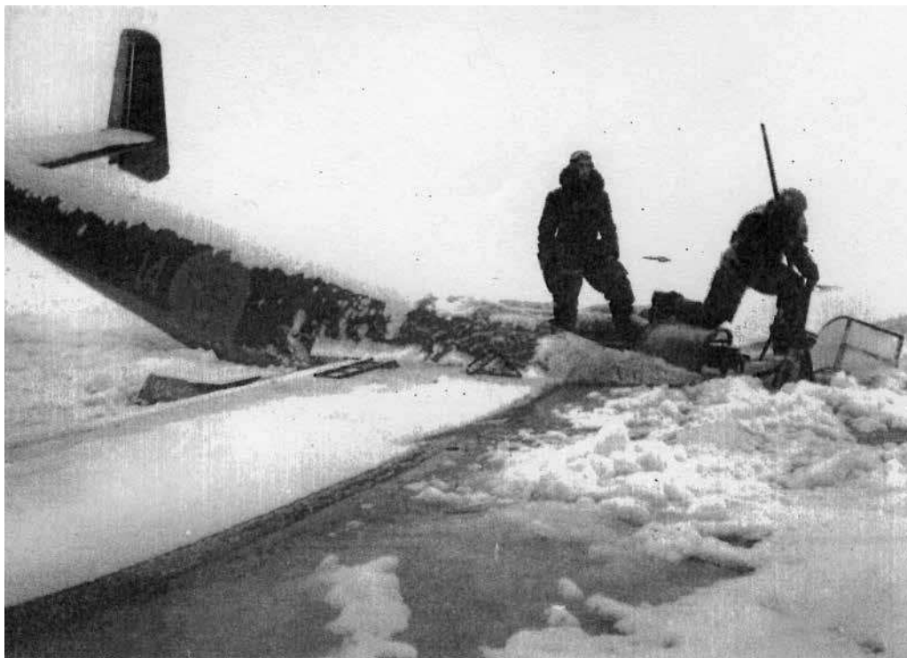
Officersmässens spritförråd fiskas upp av fu Lundin.

Samtliga divisionens flygplan utom fänrik Hoffberg med besätt-